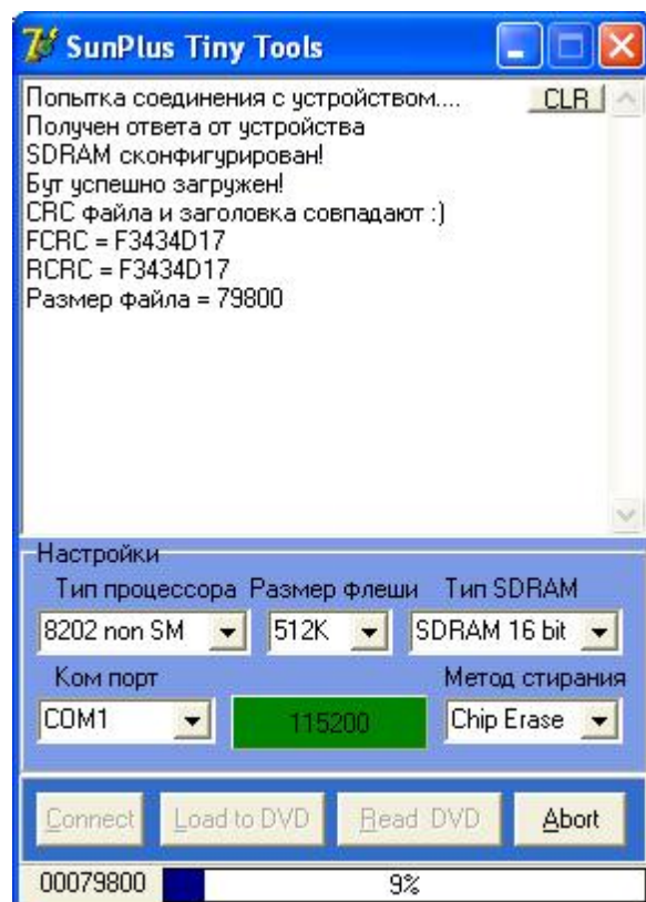
Рис.7 Идет загрузка файла в DVD.

нажимаете кнопку <Load to DVD> и в появившемся окне выбираете файл прошивки. Прошивка проверяется на целостность и начинается загрузка файла в DVD: